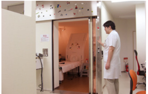
脳磁計(MEG)とシールドルーム

療、脳卒中の機能回復に対する戦略的な取り組み、認知機能を始めとする高次脳機能の評価、頭部外傷の評価、難治性疼痛に対する治療などが当面の課題となります。てんかん診療に関しましてはてんかん専門医を招聘し、週に2回のてんかん専門外来を開始いたしました。脳卒中、高次脳機能障害、頭部外傷、難治性疼痛に関しては先進的な取り組みとなるため保険診療ができていく部分があり、どのような仕組みを作るか制度上のハードルもあります。整った検査機器を十分に活用するべく今後様々な取り組みを行って参ります。