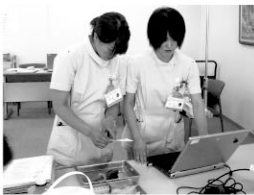
事故分析と 危険予知トレーニング